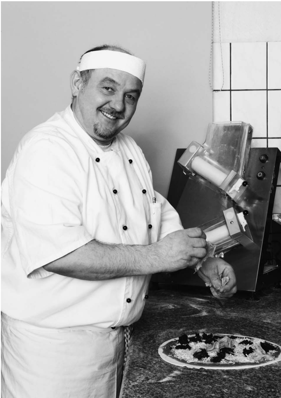
Die Arbeitskraft der Migrantinnen und Migranten war in Zeiten der Hochkonjunktur sehr gefragt.

Diesem Ansatz entspricht auch der Leistungsvertrag, der zwischen dem Bundesamt für Sozialversicherungen (BSV) und Pro Senectute für die Jahre 2010 bis 2013 abgeschlossen wurde und die finanziellen Beiträge des Bundes an die Altersstiftung regelt.