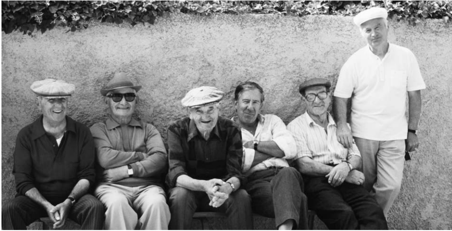
Älteren Migrantinnen und Migranten soll eine harmonische Integration und somit ein Älterwerden mit Qualität ermöglicht werden.